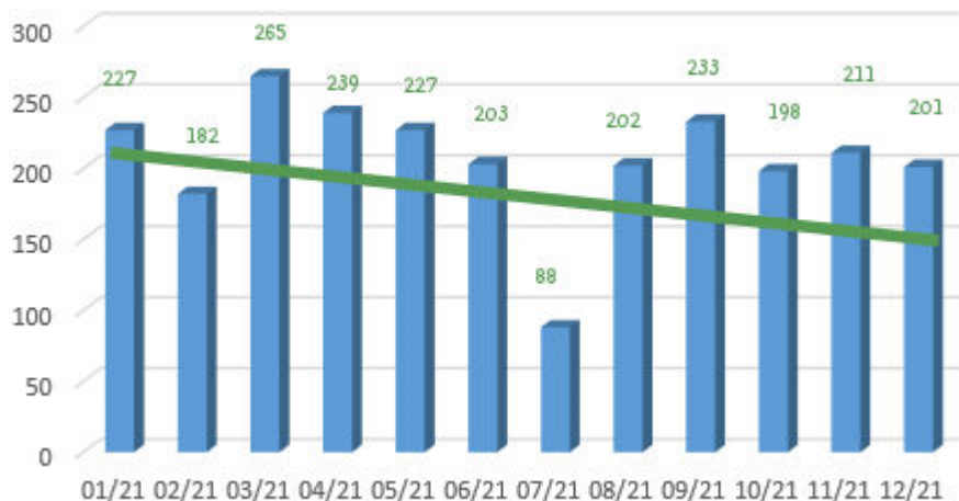
Répartition des naissances

Les naissances réparties par mois montrent une tendance à la baisse, ce qui confirme les inquiétudes générales en France sur la baisse de la natalité. Le mois de juillet est particulièrement bas, car je suis parti en vacances, et je n'ai pas noté l'état civil publié sur le journal.