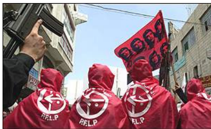
Militant F.P.L.P. En tenue avec le logo de l'organisation

Le FPLP ne présente pas de candidat aux élections du 9 janvier, alors que le PPP, le FDLP ont chacun leur candidat, n'était pas possible de présenter une candidature unique de la gauche ?