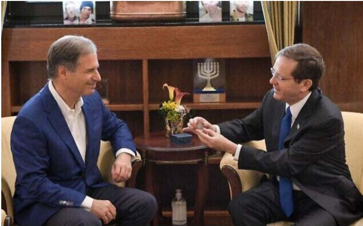
Le président Isaac Herzog, à gauche, présente à l'astronaute israélien Eytan Stibbe un cube en verre portant une prière pour le bien-être de l'État d'Israël, à la résidence du président à Jérusalem, le 16 décembre 2021.

Dans un livre de prière français de 1963, j'ai trouvé une prière pour l'état d'Israël annoté ainsi :