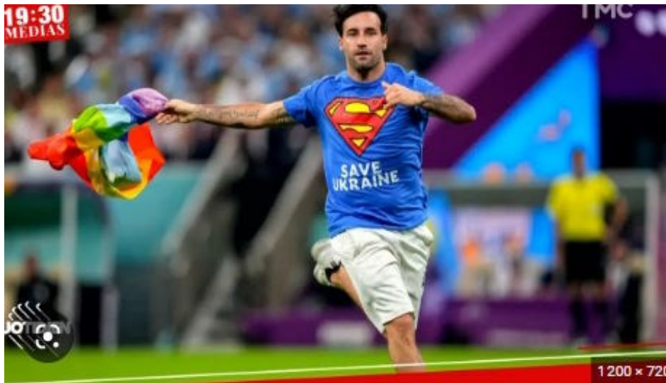
Un homme arrêté après s'être introduit sur un terrain avec le drapeau LGBT

D e même toute allusion à l' Ukraine et à tout autre question politique était interdite, personne n'a mis en avant la persécution des musulmans en Chine , car si la Police a rapidement remis de l'ordre, et a empêché toute manifestation intempestive.