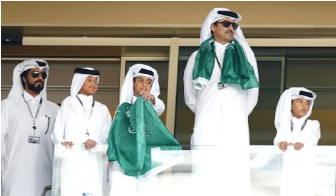
L'émir du Qatar, Tamim Ben Hamad Al Thani, porte un drapeau de l'Arabie saoudite, le 22 novembre 2022 à Doha (Qatar), lors du match de la Coupe du monde Argentine-Arabie saoudite.

O pendant la coupe du monde, si le Qatar a été éliminé dès le premier round, l'Arabie a réussi à passer la première étape, et on a vu l'Emir du Qatar supporter l'équipe d'Arabie, le foot a renforcé le liens entre ces deux pays, mais il n'y a pas eu de gestes comparables entre le Qatar et l'Iran.