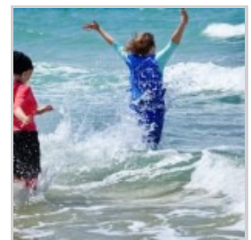
Femmes religieuses à la plage séparée